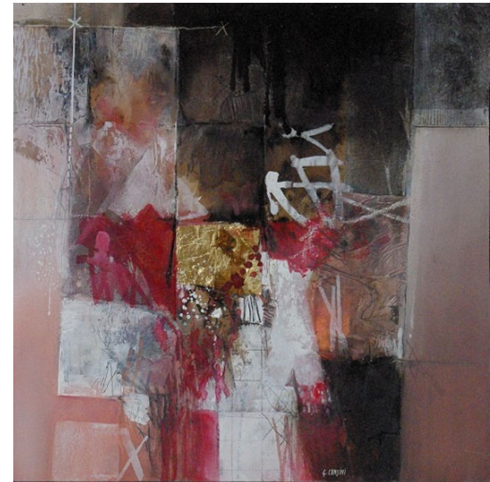
"Un pensiero in rosa" cm 80x80, t. mista su tavola - 2015