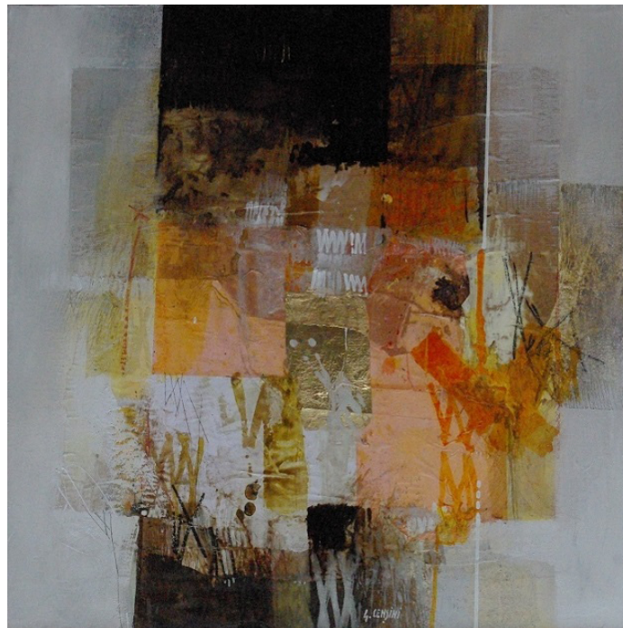
"Un mattino in rosa" cm 60x60, t. mista su tavola - 2016