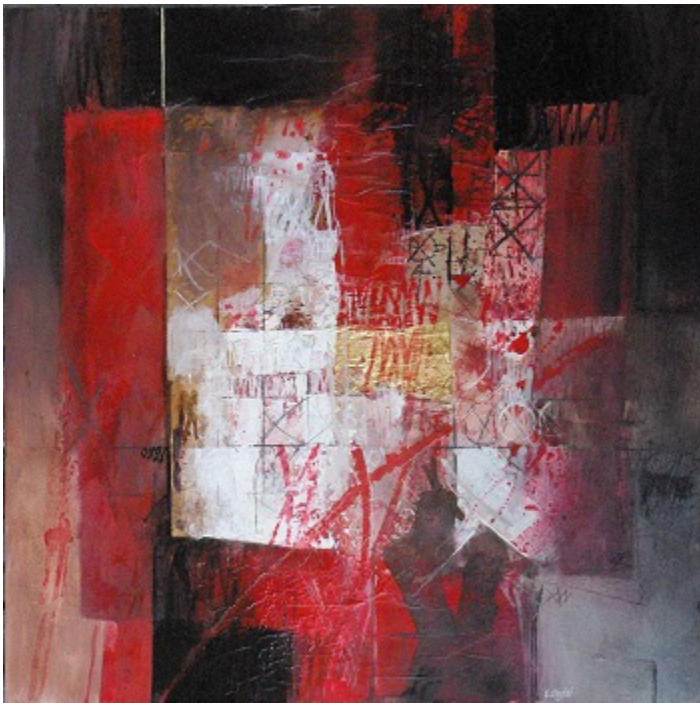
"Rosso di sera", cm 80x80, t. mista su tavola - 2015